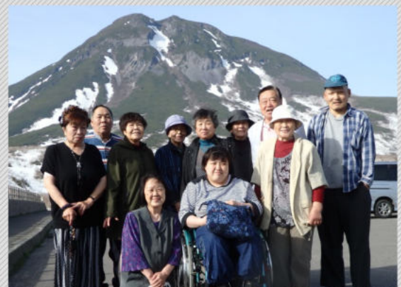
(写真) 知床連山を背景に

当日は天気にも恵まれ、行く先々の観光地もたくさんの方で賑わっていましたが、それ以上に参加された方々が楽しそうにしており、久しぶりに会う仲間との交流も深まったようです。交流会での意見交換では、来年度事業の話し合いも行われ、会の発展がますます期待できそうです。