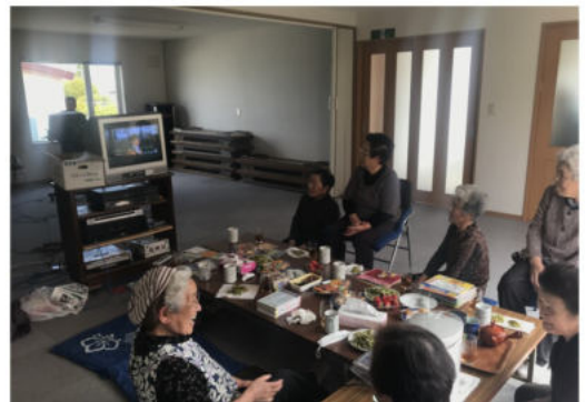
(写真) 茶菓子を囲み和やかな雰囲気

会員は10名ほどで、現在は尾幌地区だけではなく、町内のカラオケ好きが集まり活動中。歌の合間には、近況報告など日々の話題が飛び交います。カラオケは、歌詞を思い出す、リズムに合わせるなど、様々な脳の機能を使うので介護予防につながります。ぜひこれからも住み慣れた地域で元気に過ごすため、活動を続けて欲しいと思います。