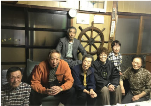
(写真) 舵輪の前で記念撮影

■新年度「お茶会」第一弾は、若竹にある(有)厚岸さけ定置番屋で、毎月10日に集まり例会を行っている「竹の会」さん。