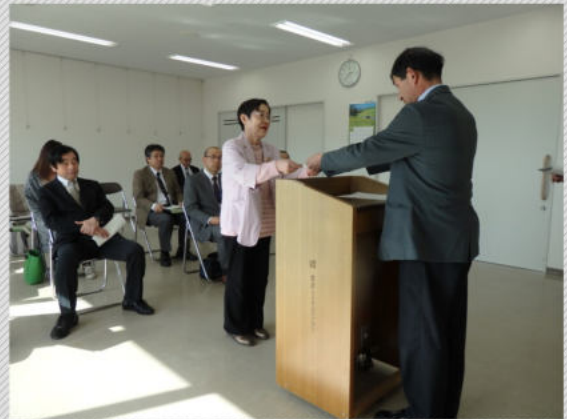
(写真) 交付書を受け取る各団体の代表

受け取った団体からは「いただいた助成金は大切に活用させていただきます。」との声が寄せられました。