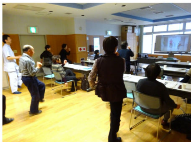
(写真) 作業療法士の指導で介護予防体操