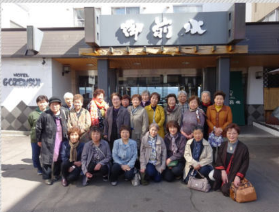
(写真) 参加したみなさんで記念撮影

厚岸町老人クラブ連合会女性部では、毎年1泊2日の温泉旅行を通じて、日頃の疲れをリフレッシュすること、親睦と交流を図ることを目的に、女性部交流旅行を行っています。